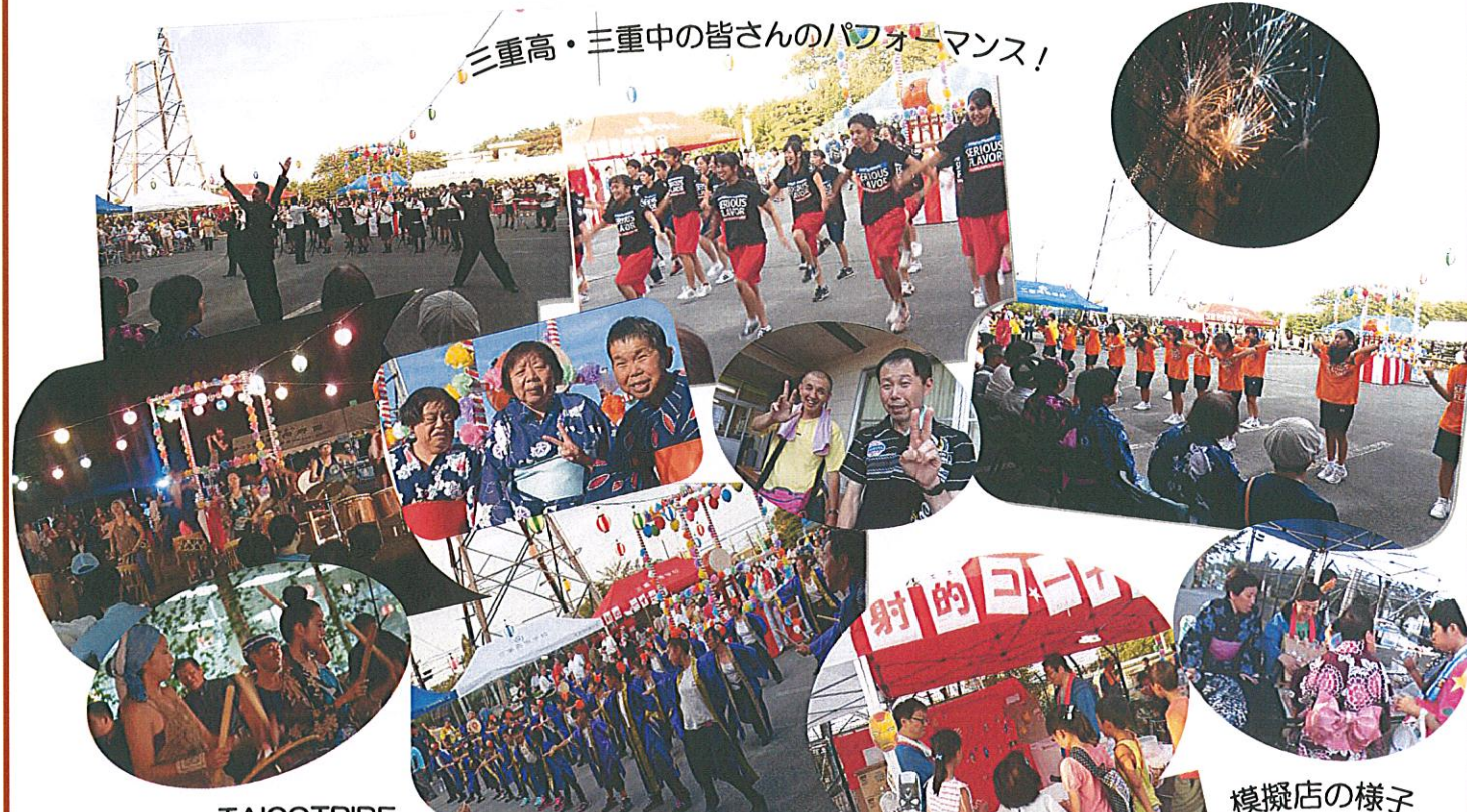
三重高・三重中の皆さんのパフォーマンス!

7月30日、恒例の夏まつりを向野園にて開催しました。 今年はずっとさか福祉会設立三十周年という区切りの年でもあり、例年以上に梅村地区の住民の方、徳和地区の小学生の方々も多数参加して頂き、盆踊り・花火・模擬店等を通して地域の方々との連携・理解を深めることができました。 猛暑の中、来場者は五百人を超えるほどの盛況ぶり、三十周年の記念の年に相応しい夏まつりとなりました。